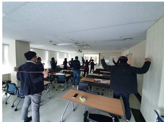
교육장 대관 사용 예

※ 인천근로자건강센터는 산업안전보건법(제4조제10호)에 근거하여 한국산업안전보건공단에서 업무를 위탁받아 운영하고 있습니다.